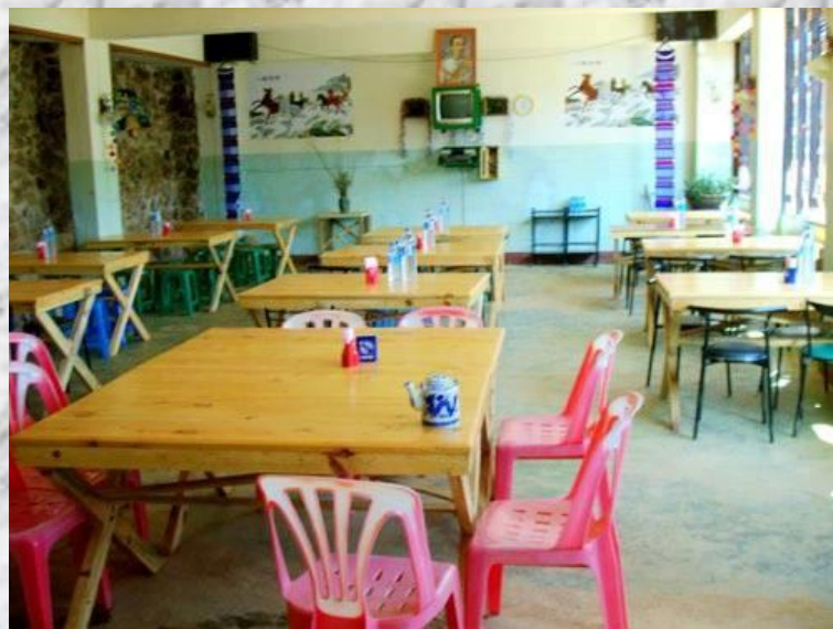
ห้องอาหาร

สำหรับบ้านพักบนดอยอย่างข้างจะเป็นบ้านพักรวมนะครับ พักห้องละ 4-6 ท่านครับ เพราะโปรแกรมเที่ยวดอย จะต้องพักกันแบบนะครับ(ลุยๆหน่อยนะ)