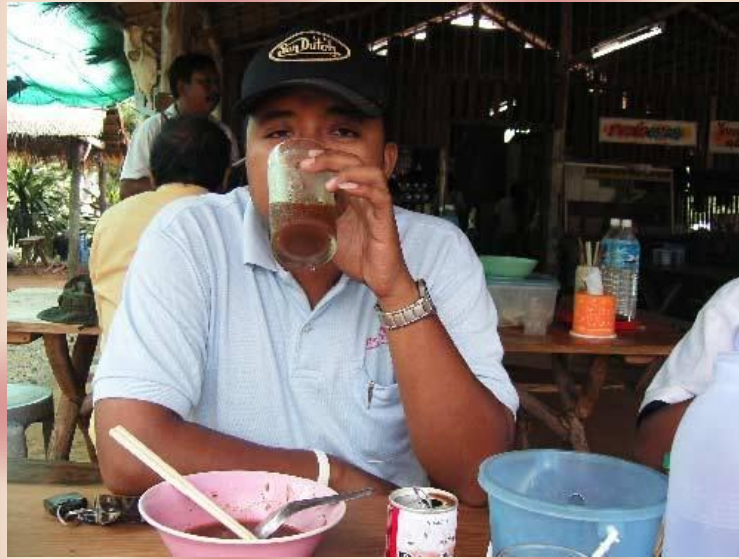
แวะรับประทานอาหารระหว่างการเดินทาง ส่วนภาพนี้โต๊ะไกด์.. เบอร์ดี หนึ่งในใจ พี่ไชน้อย(DRIVER)