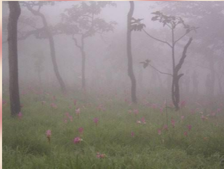
อึม...อากาศ ดี มาก..ๆ ครับ สดชื่นจริงๆเลย