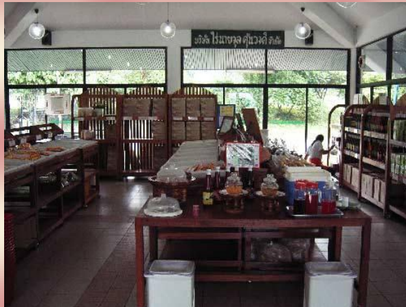
จุดต่อมาก็จะแวะซื้อของฝากที่ไร่กำนันจุล